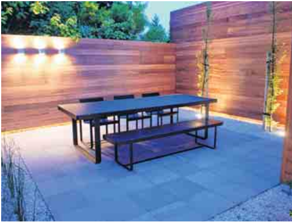
's Avonds verleent indirecte verlichting de tuin extra luister.