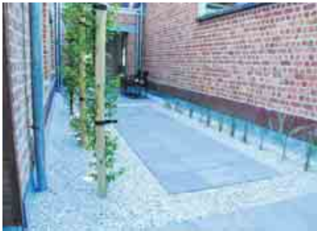
Rond de terrassen ligt glanzend wit grind.