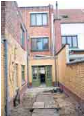
De ravage vooraf.