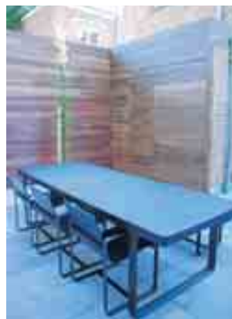
Een deel van de muren werd bekleed met padoekhout.