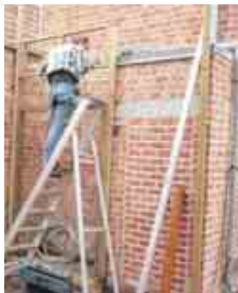
De oude bakstenen werden gezandstraald en opnieuw gevoegd.